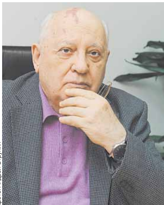
Горбачев никогда не снимал с себя бремя ответственности, не назначал стрелочников...

2 марта Михаилу Сергеевичу исполнится 85