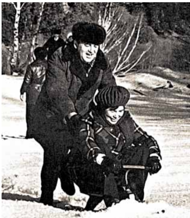
Северный Кавказ. 1980 г.

Встретившись еще студентами, они как-то сразу поняли – будут вместе. На всю жизнь. Так и случилось. А какие теплые письма он ей писал!