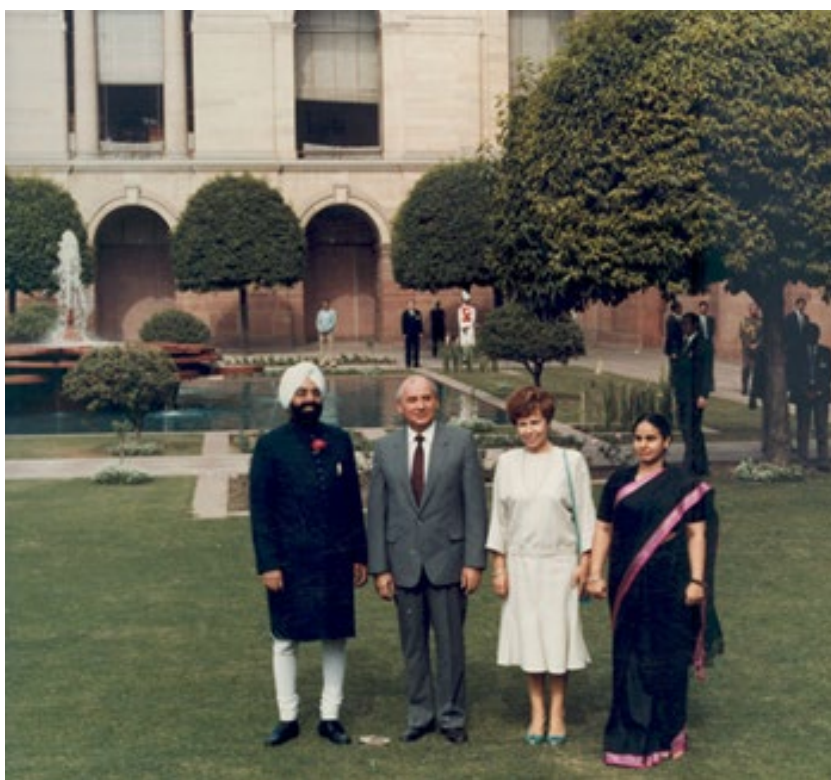
Индия. Ноябрь 1986 г. Заил Сингх, М.С. Горбачев, Р.М. Горбачева

бедность целых континентов – все эти реалии требуют нового мышления, нового подхода, требуют прекращения гонки вооружений. В политике Советского Союза в вопросах войны и мира много общего с политикой Индии. Мнение СССР и мнение Индии – это мнение одного миллиарда человек. Мы готовы сотрудничать с Индией и дальше, учитывая новые требования времени. Уверен, что визит внесет новый вклад в развитие советско-индийских отношений».