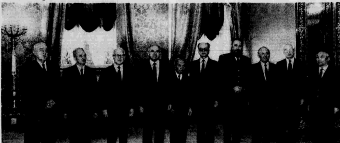
Перед началом встречи.