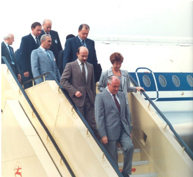
Прибытие М.С. и Р.М. Горбачевых в Индию

25 ноября 12 часов по делийскому времени. Аэродром Палам. Советский авиалайнер выруливает к месту торжественной церемонии 34 .