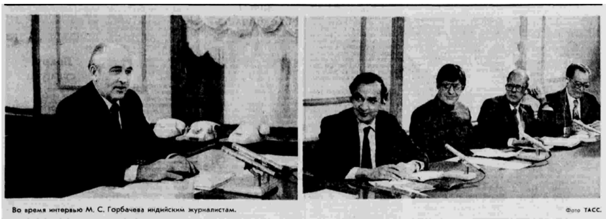
Во время интервью М. С. Горбачева индийским журналистам.

21 ноября в связи с предстоящим визитом в Индию М.С. Горбачев дал интервью индийским журналистам 29 .