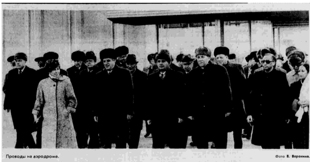
Проводы на аэродроме.

Вместе с М.С. Горбачевым отбыли член Политбюро ЦК КПСС, министр иностранных дел СССР Э.А. Шеварднадзе ; Секретарь ЦК КПСС А.Ф. Добрынин ; заместитель Председателя Совета Министров СССР В.М. Каменцев ; помощник Генерального секретаря ЦК КПСС А.С. Черняев ; начальник Генерального штаба Вооруженных Сил СССР, первый заместитель министра обороны СССР С.Ф. Ахромеев ; первый заместитель министра иностранных дел СССР Ю.М. Воронцов . В поездке Генерального секретаря ЦК КПСС сопровождала его супруга Р.М. Горбачева . По пути в Индию М.С. Горбачев сделал остановку в Ташкенте.