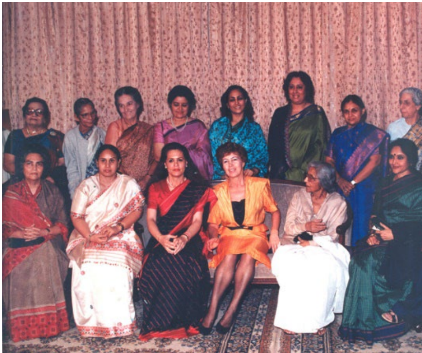
Индия. Ноябрь 1986 г. Р.М. Горбачева на встрече с С. Ганди и группой индийских женщин, видных политических и общественных деятелей страны

Из мемуаров М.С. Горбачева «Жизнь и реформы»: «Раиса Максимовна провела много времени в беседах с Соне́й Ганди. Среди многообразных мероприятий ее программы упомяну о встрече с группой индийских женщин. Получился весьма интересный разговор о положении