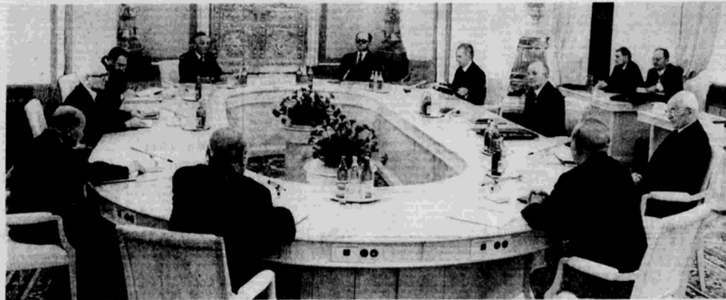
На встрече руководителей братских партий.