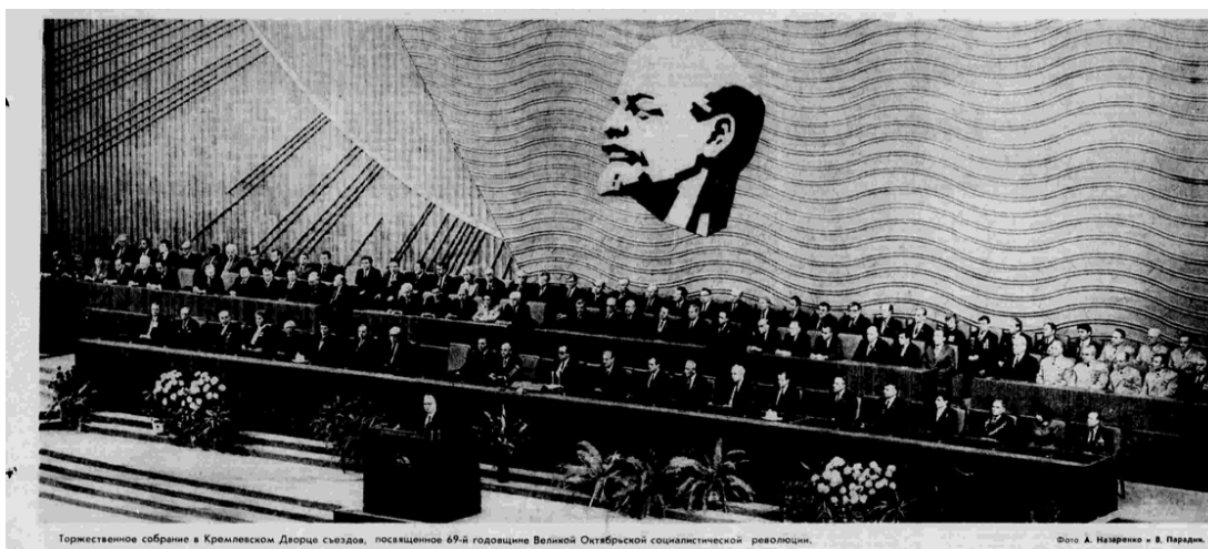
Торжественное собрание в Кремлевском Дворце съездов, посвященное 69-й годовщине Великой Октябрьской социалистической революции.

6 ноября в Кремлевском Дворце съездов состоялось Торжественное собрание, посвященное 69-й годовщине Великой Октябрьской социалистической революции 9 .