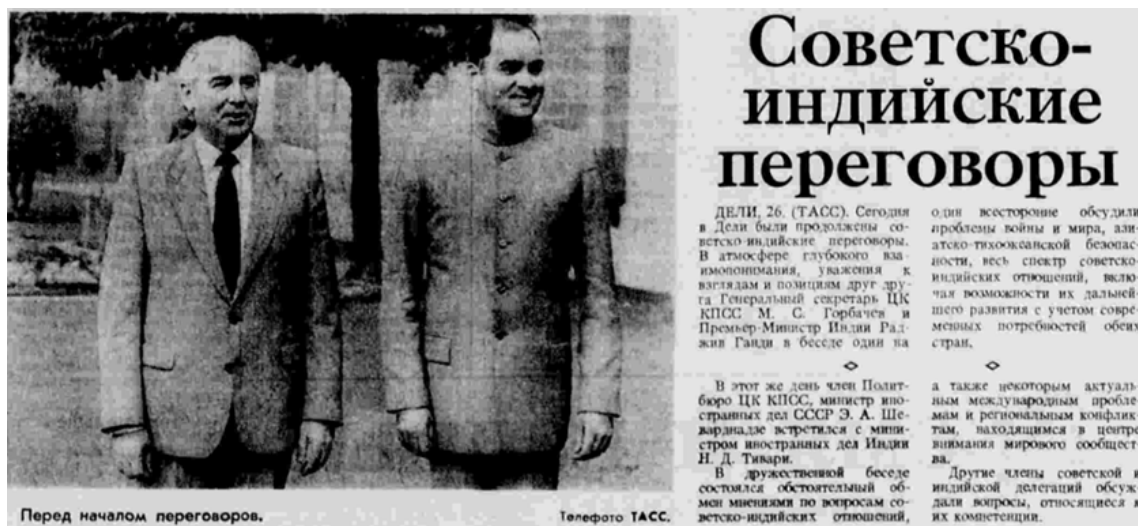
Перед началом переговоров.