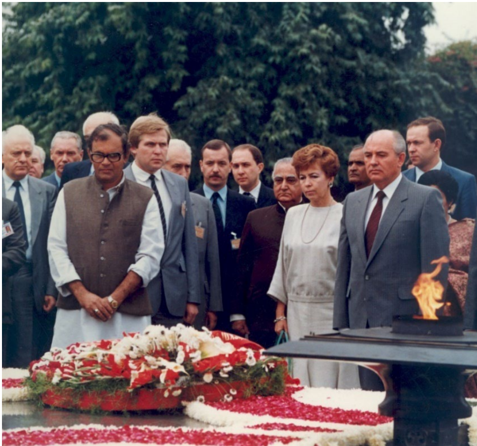
Индия. Горбачев М.С., Горбачева Р.М., Шеварднадзе Э.А.

М.С. Горбачев побывал на Радж Гхат – мемориал Махатмы Ганди и на месте его кремации возложил венок, на ленте которого надпись: «М. Ганди – вождю борьбы индийского народа за национальное освобождение».