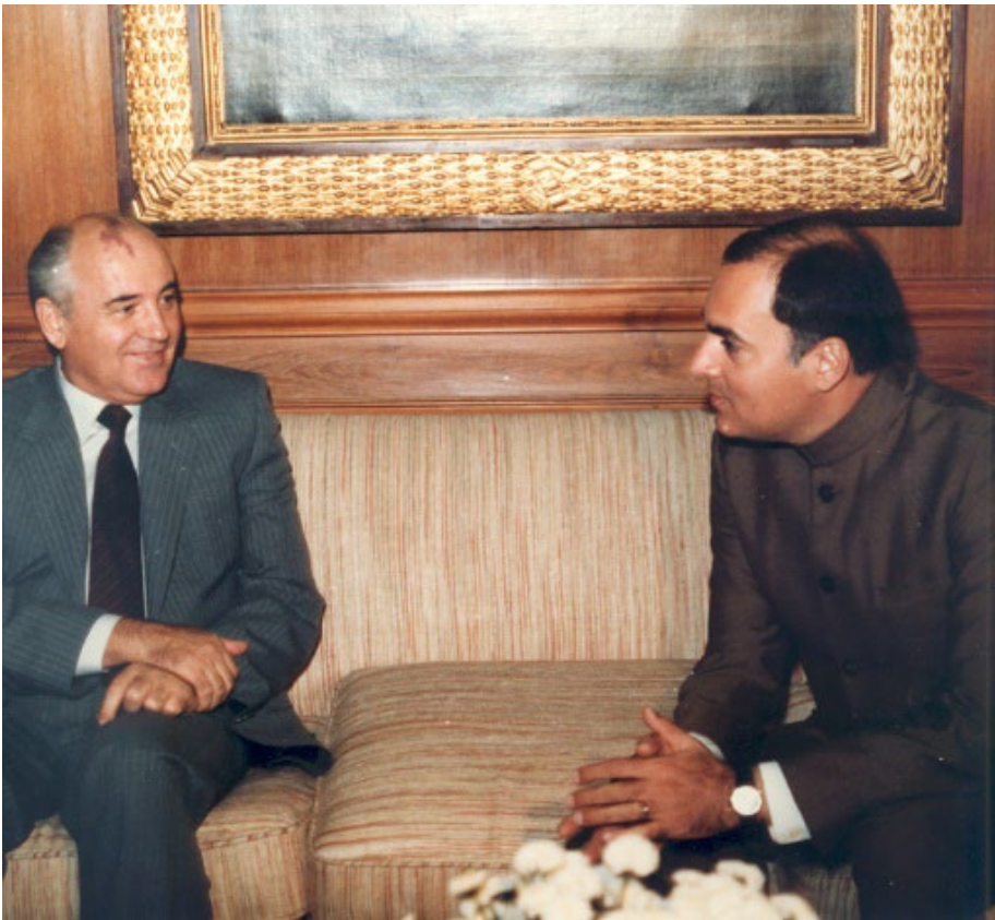
Индия. Ноябрь 1986 г. М.С. Горбачев и Р. Ганди

«Любимым партнером из «третьего мира» для Горбачева стал Премьер-министр Индии – умеренный и образованный Раджив Ганди.