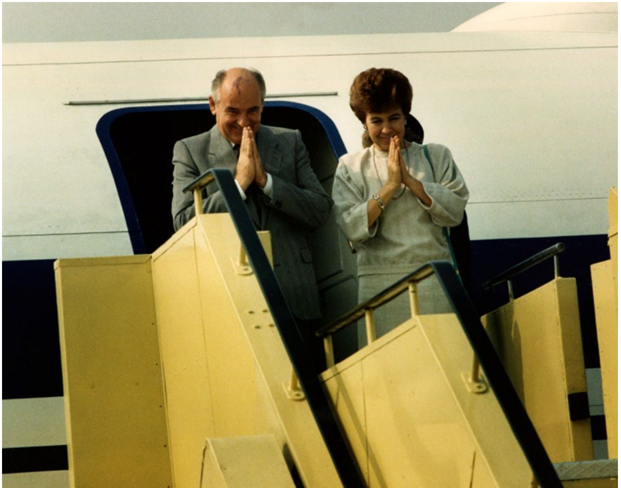
Индия. 28.11.1986 г. На трапе самолета. М.С. Горбачев, Р.М. Горбачева