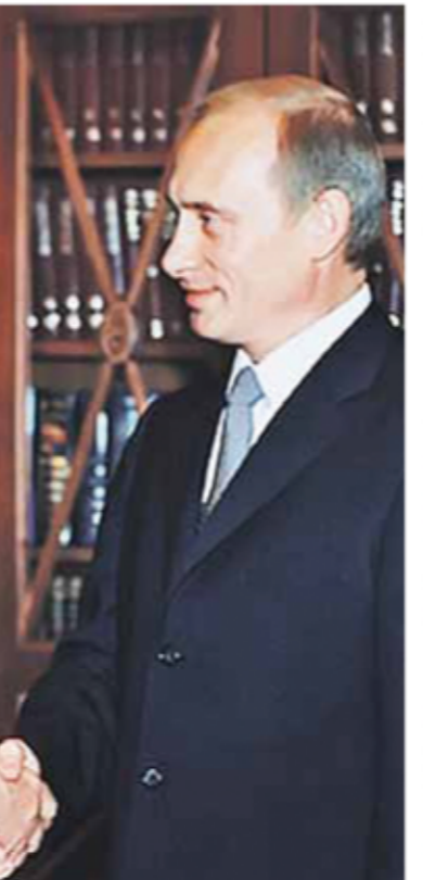
Михаил Горбачев общался с Владимиром Путиным не один раз...